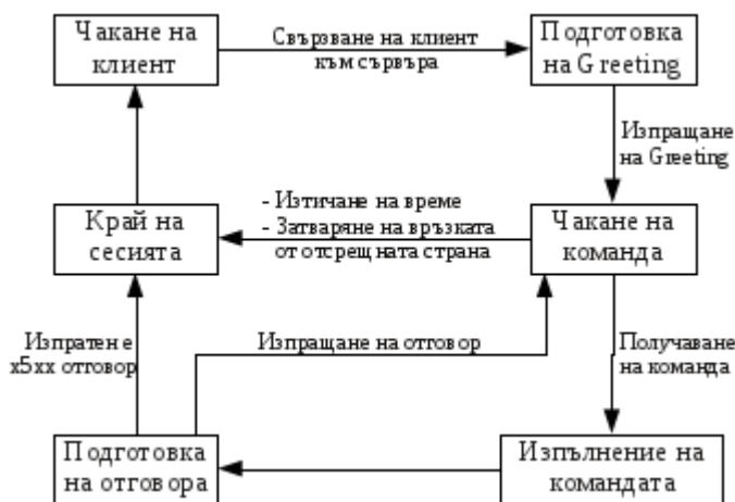
Фигура 2: Схема на състоянията на сървъра на РЕГИСТЪРА (REGRR сървъра)

На Фигура 2 е показана схема, описваща състоянията на сървъра на РЕГИСТЪРА, играещ ролята на REGRR сървър в комуникацията по протокола REGRR. На Фигура 3 може да се види схема на състоянията на REGRR клиента (сървър на РЕГИСТРАТОРА).